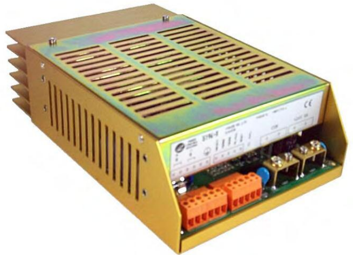
Dimensions : 242 x 153 x 68mm / Poids : 1640g

La charge est de type "Floating". Ce principe permet de charger les batteries et de maintenir un léger courant d'entretien lorsque celles-ci sont chargées.