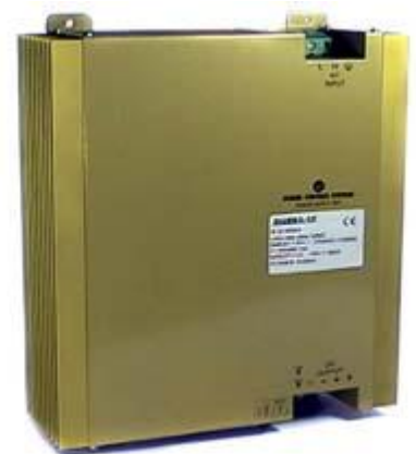
Dimensions : 263.5 x 246 x 80 mm / Poids : 4650g

La charge est de type "Floating". Ce principe permet de charger les batteries et de maintenir un léger courant d'entretien lorsque celles-ci sont chargées.