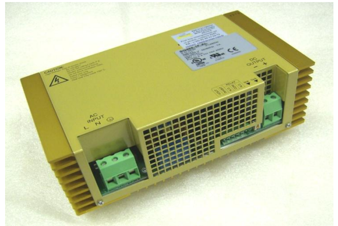
Dimensions : 246 x 133 x 80 mm / Poids : 2650g

La charge est de type "Floating". Ce principe permet de charger les batteries et de maintenir un léger courant d'entretien lorsque celles-ci sont chargées.